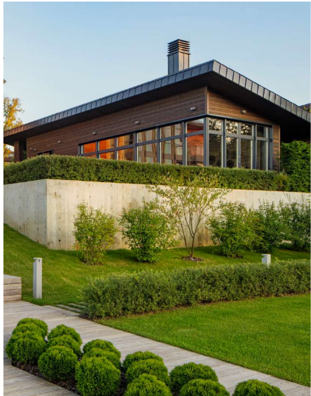
Дом со спа по проекту бюро BIGO — пример вертикальной планировки территории.