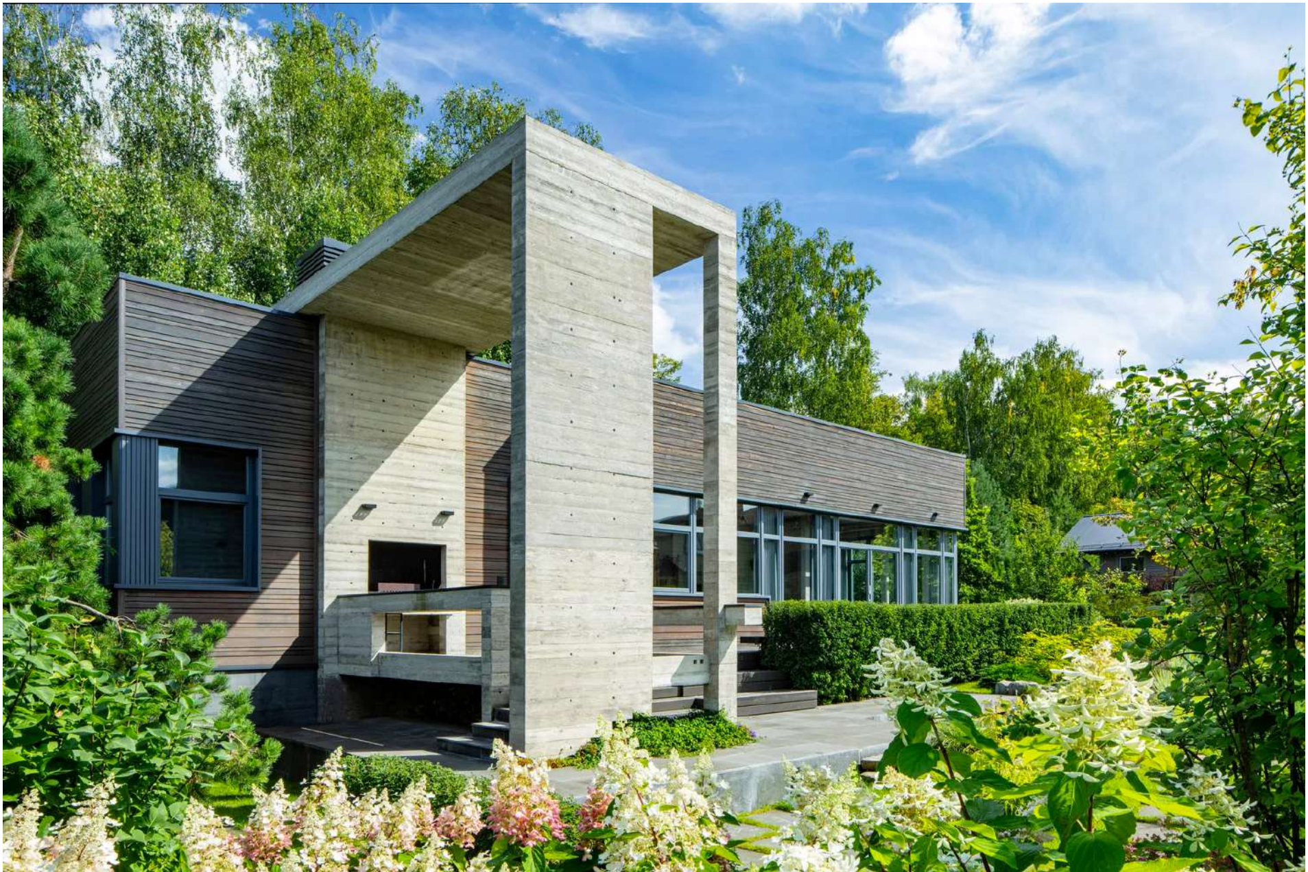
Гостевой дом с барбекю по проекту бюро BIGO. Доминантой дома стала бетонная печь для барбекю, которая переходит в бетонную скобку и перекрывает площадку для приготовления еды на улице.