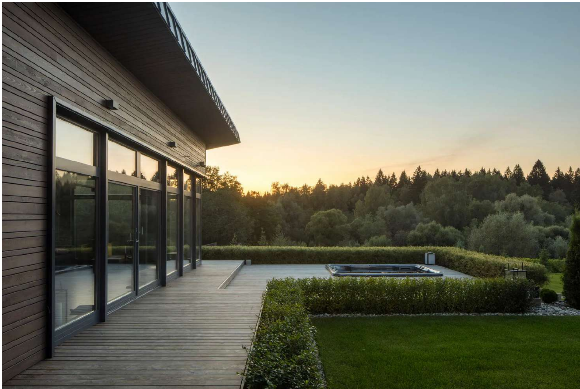
Дом со спа по проекту бюро BIGO.