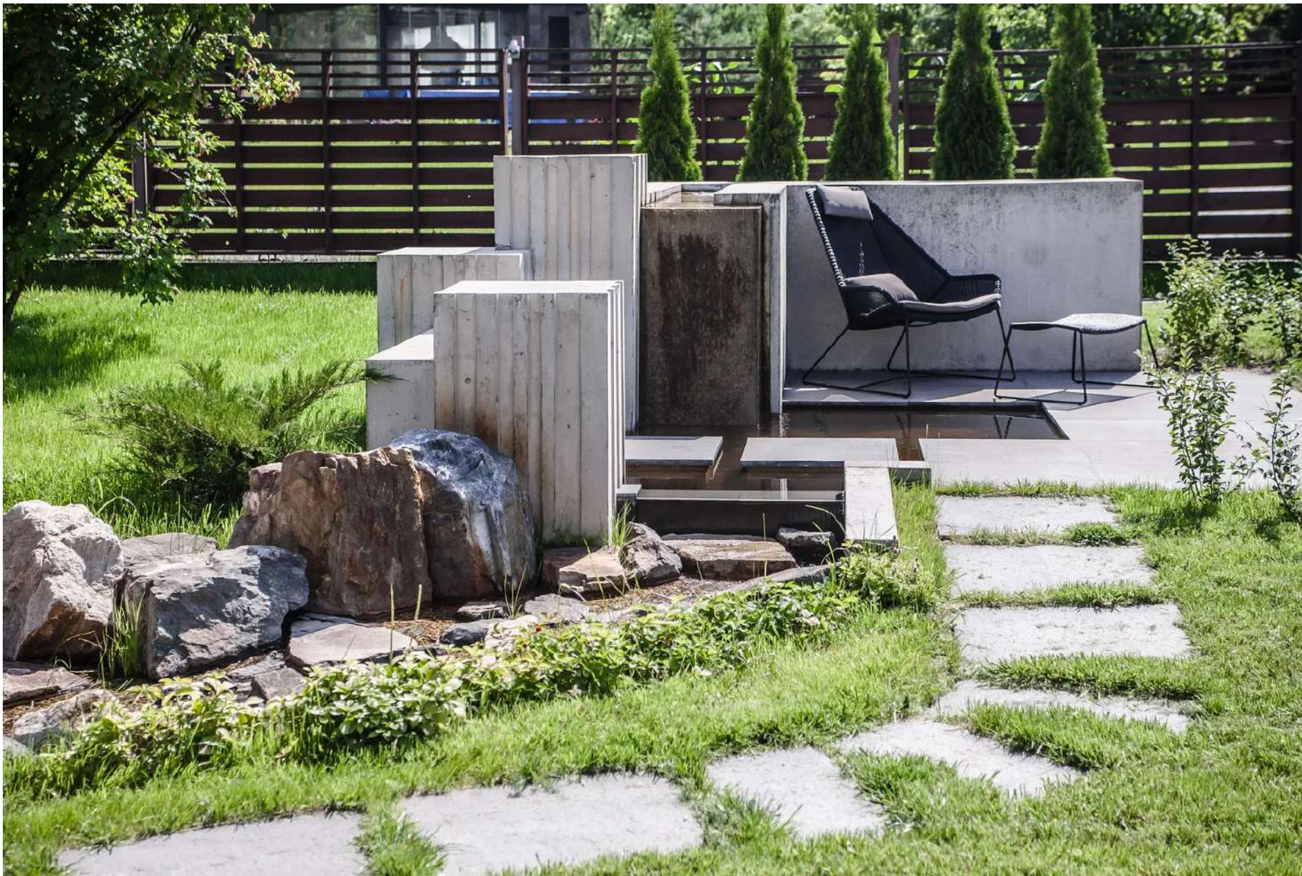
Гостевой дом с барбекю по проекту бюро BIGO.