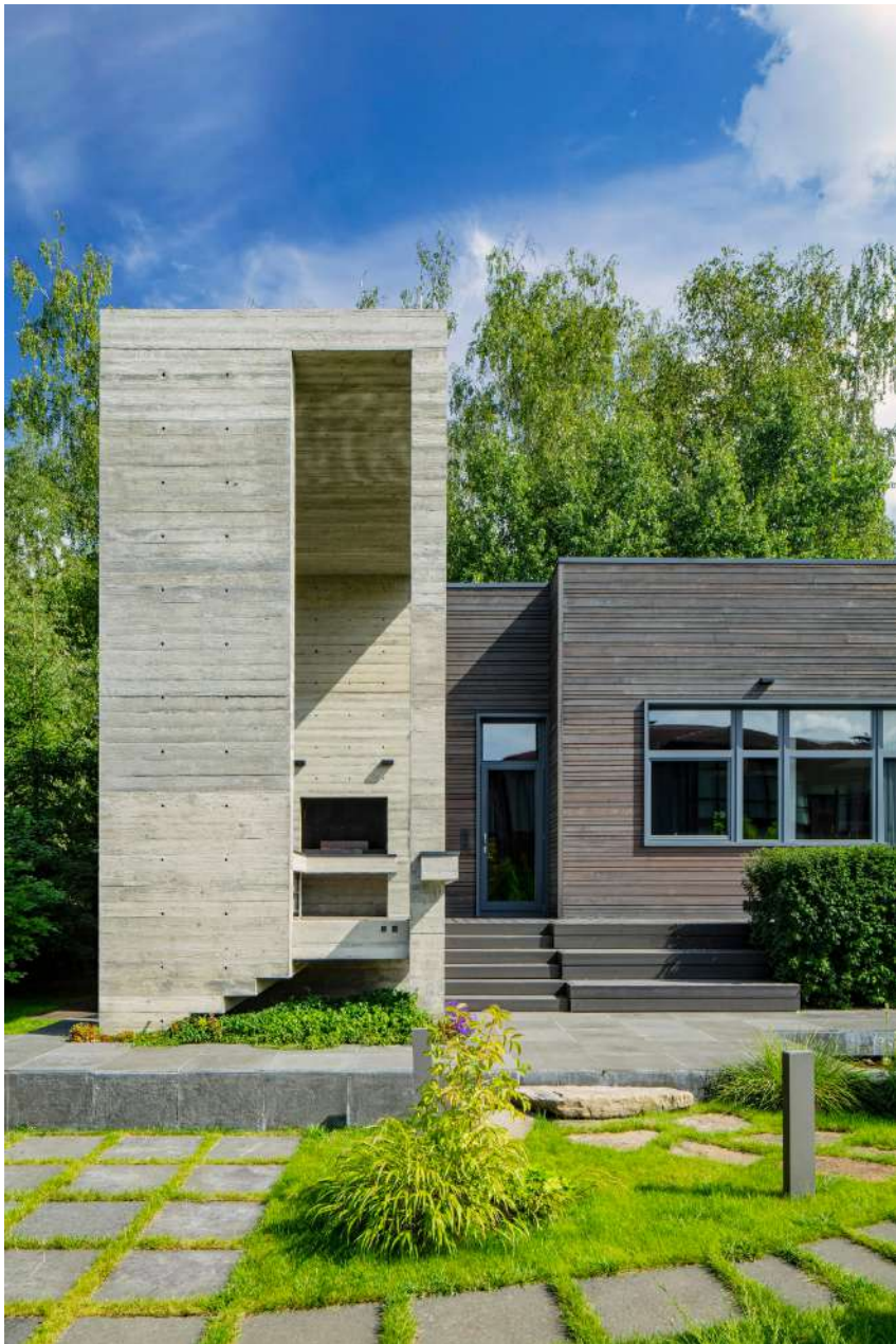
Гостевой дом с барбекю по проекту бюро BIGO.