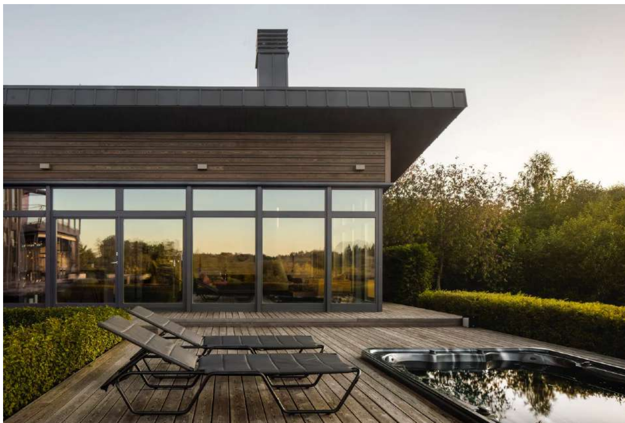
Дом со спа по проекту бюро BIGO. Интегрированный в террасу уличный спа-бассейн можно использовать даже зимой.