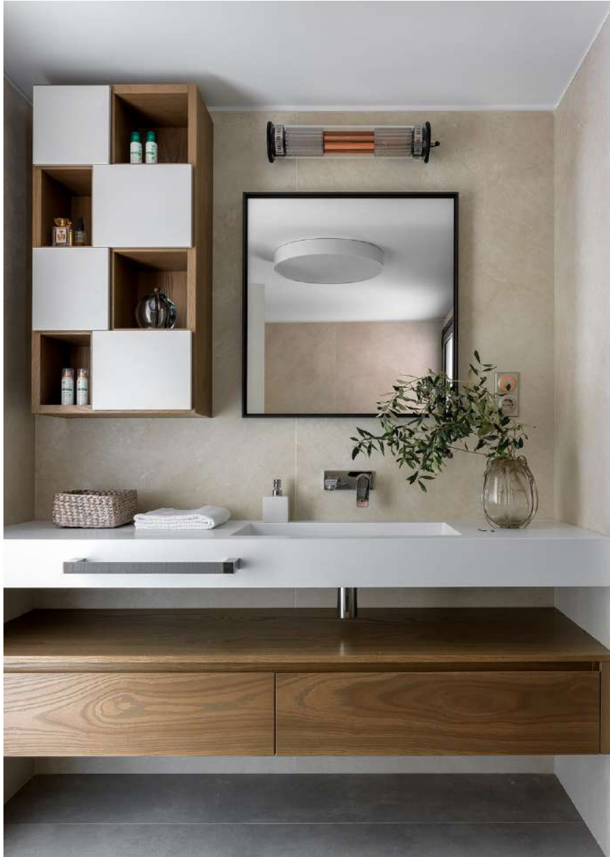
Proyecto e información: Estudio de arquitectura BiGO . Estilista: Patricia Ketelsen .