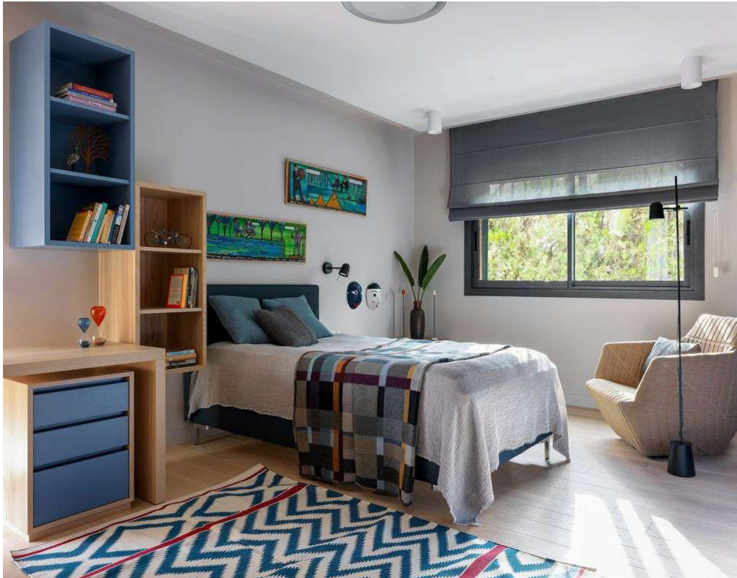
Cama de Treca. Máscaras de Hay.