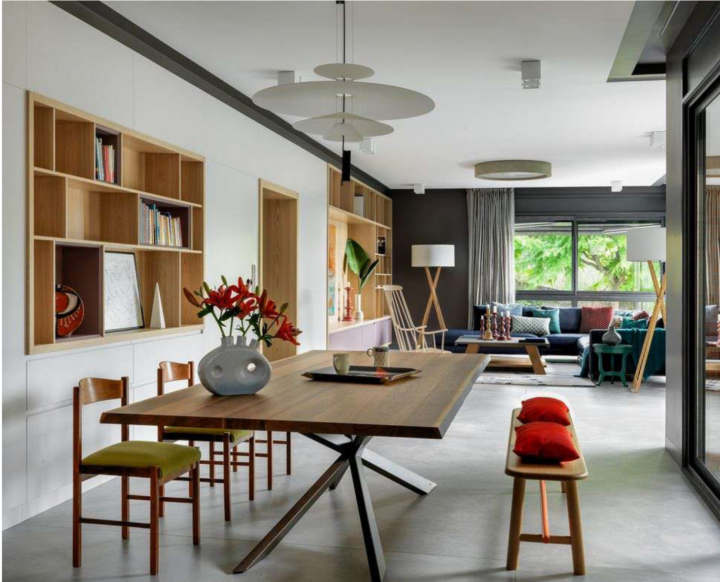
La mesa de comedor, amplia y cómoda, procede de la marca Cattelan Italia. Las sillas vintage se adquirieron en la galería Antique Boutique. Sergey Krasnyuk