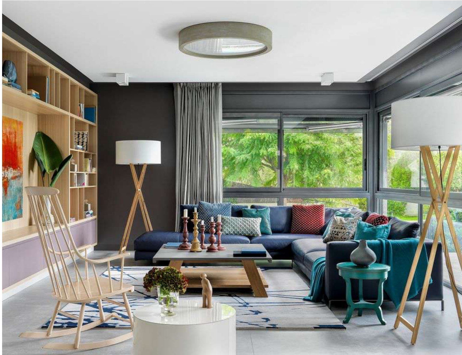
El sofá es de B&B Italia. La mecedora vintage y la mesa en laca blanca, de Antique Boutique. La mesa de centro, de Meridiani, y la pequeña mesilla azul, de Salda. La lámpara, de Lucifer Lighting, y las de pie, de The Marset. La alfombra la firma BSB.